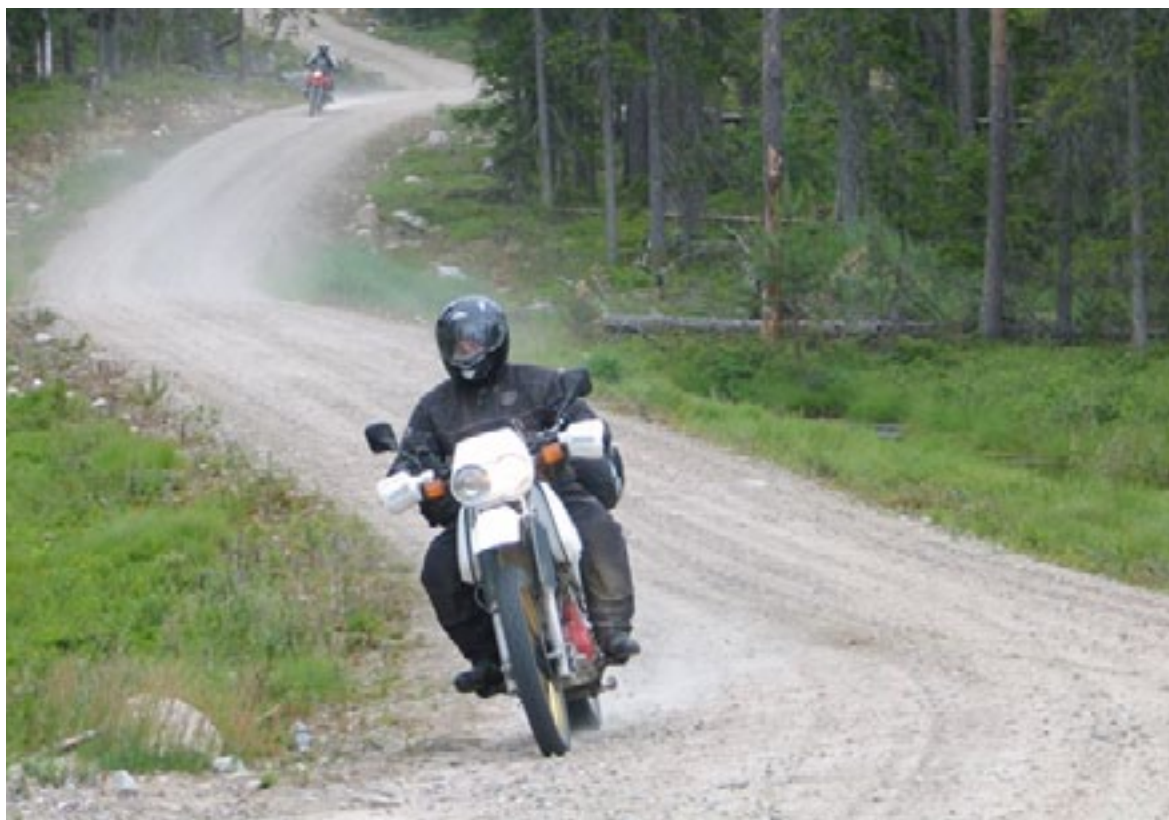
Metsäteillä hiekka pölyää

Viimeistä kertaa avoimelle yleisölle järjestetty Kontioralli sijoittui vuodelle 2010. Nykyään järjestäjähdistyksen MP69 jäsenet saavat osallistua kyseiseen tapahtumaan. Vaikka tapahtuma on tänä päivänä muilta suljettu, käsittelee MP69 järjestö tuhansia jäseniä, joten kävijäkunta tuskin tulee romahtamaan. Tämä artikkeli on kirjoitettu antamaan yleiskuva Suomen yhdestä suurimmasta koontumisajosta ja maustettu muutamalla kuvalla parin menneen vuoden tunnelmista.