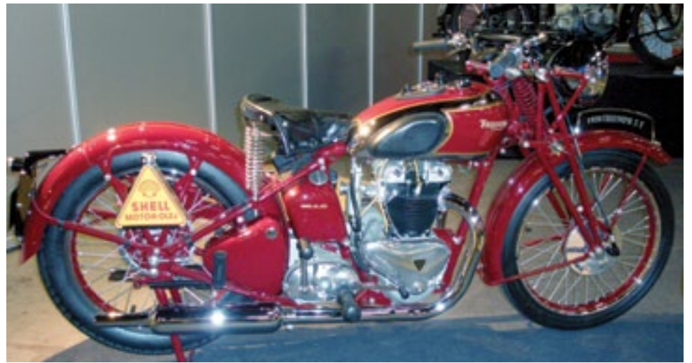
Triumph 1930-luvulta. Kuva vuoden 2011 MP-messuilta.

1940-luvulla moottoripyörien kehitys ei ollut enää yhtä nopeaa. Tyypil-