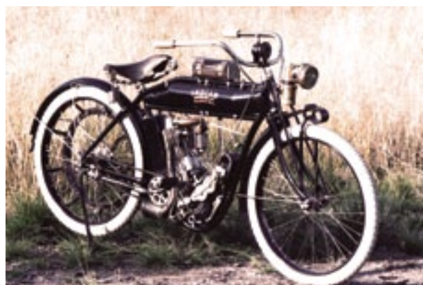
Amerikkalaisvalmisteinen Indian vuodelta 1910.

Moottoripyörien seuraavia kehittelyn kohteita olivat jousitus ja vaihteisto. Ensimmäisen maailmansodan aikoihin kaikissa suuremmissa moottoripyörissä oli jonkinlainen jousitus etupyörässä ja takapyörän jousitus alkoi myös syntyä. Vuonna 1901 perustettiin Indian, joka on ensimmäinen amerikkalainen moottoripyörä. Siihen oli kehitetty kaksivaihteinen hammaspyörävaihteisto, jonka yhteydessä vaihteen vaihto tapahtui kytkimellä